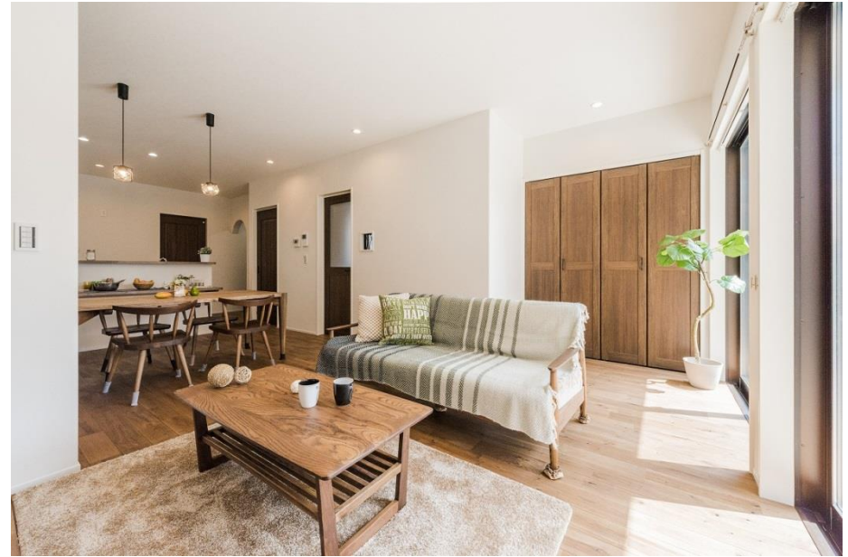
※写真は施工事例です