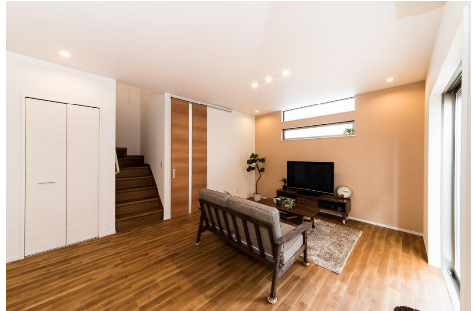
※写真は施工事例です